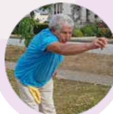
Concours de pétanque