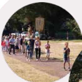
Pardon chapelle Sainte Reine