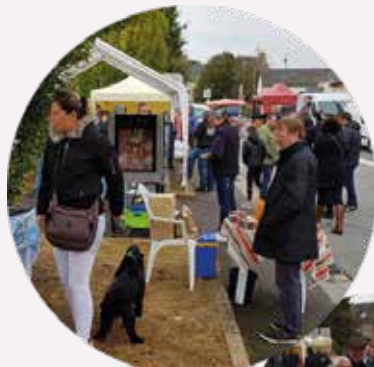
Marché du goût