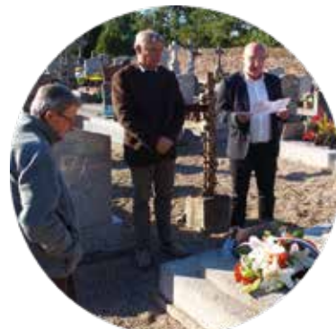
Hommage aux Harkis