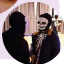
Les enfants de Beignon fêtent Halloween