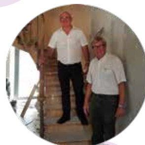
Visite du chantier de la mairie