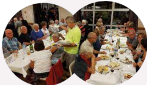
Fête de la bière