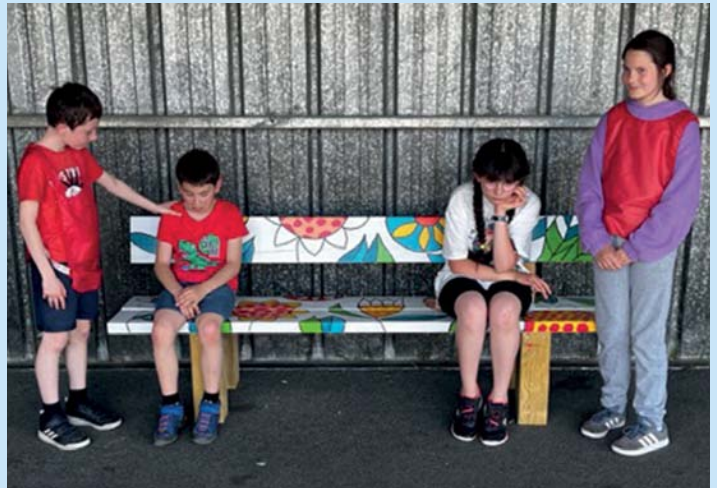
Elèves en atelier philo

“ L'amitié c'est être heureux ensemble, partager, parfois se disputer et accepter ou pas les avis de l'autre. ”