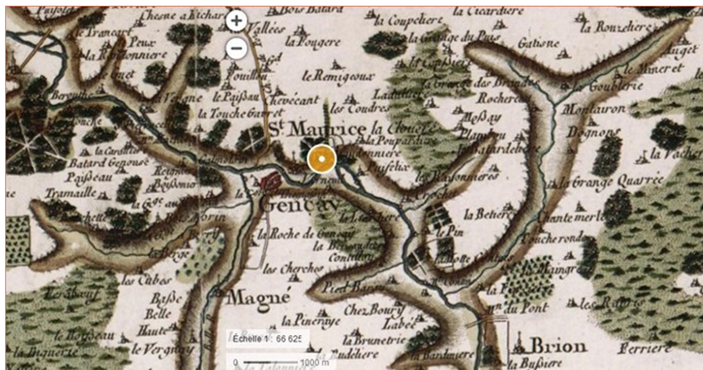
La Ménéoffe sur la Carte de Cassini (XVIII siècle)

Le fonctionnement de la Ménéoffe était fortement perturbé en raison d'un étang construit sans autorisation dans les années 70. Le cours d'eau avait alors été déplacé en bord de parcelle, « perché » à l'image de nombreux biefs de moulin ; une buse en détournait le débit à son profit. Les nouveaux propriétaires ont découvert le caractère illicite de l'ouvrage et constaté que l'étang parvenait difficilement à retenir l'eau. Ils ont conduit une étude