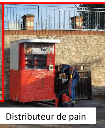
Distributeur de pain