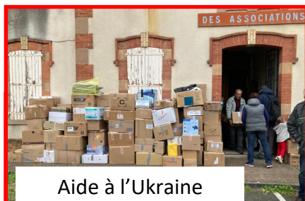
Aide à l'Ukraine

Vu le coût, le Conseil Municipal décide, de ne pas installer de borne de recharge électrique.