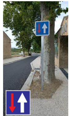
Sens de priorité