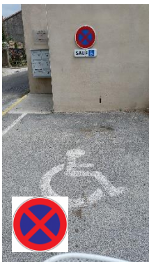
Arrêt et stationnement interdits, sauf pour les personnes à mobilité réduite, obligation de visibilité de la carte CMI.