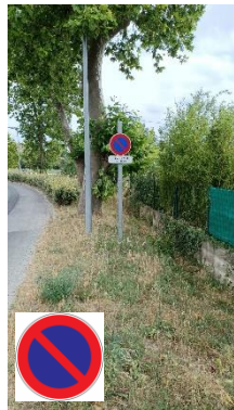
Stationnement interdit sur D104 et D60