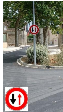
Céder le passage à la circulation venant en sens inverse