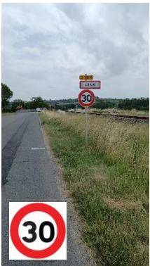
Traversée du village limitée à 30km/h sauf pour les zones à 20 km/h.