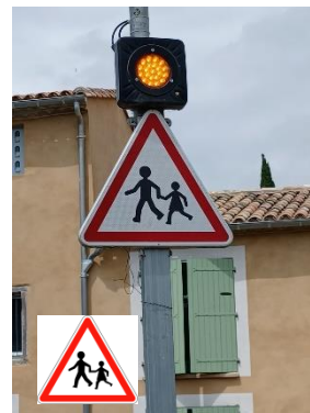
Endroit fréquenté par des Enfants.