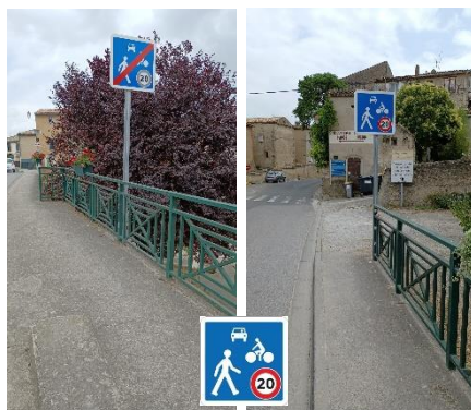
Entrée zones de rencontre. Priorité aux piétons et aux vélos. Limitation à 20km/h.