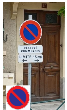
Stationnement limité à 15 min réservé à la clientèle