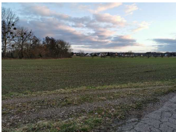
Aspacher Feld (A)

Suite à notre jeu « Trouver le lieu-dit », 3 participants ont trouvé les bons lieux-dits :