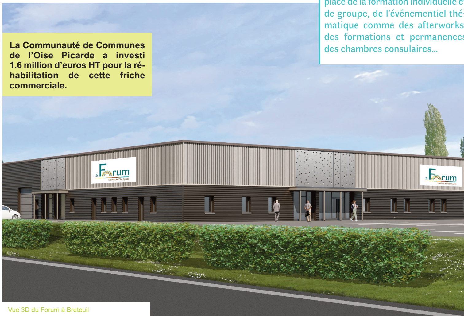
Vue 3D du Forum à Breteuil

La Communauté de Communes de l'Oise Picarde a investi 1.6 million d'euros HT pour la réhabilitation de cette friche commerciale.