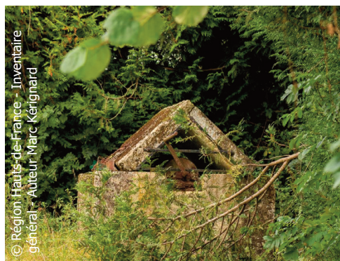
Le village du Gallet - Puits rue du Pressoir avec ses maçonneries anciennes en pierre de taille calcaire

Cet inventaire constitue non seulement une étape nécessaire pour l'obtention du label « Pays d'art et d'histoire » décerné par le ministère de la Culture, mais également une opportunité de mieux connaître l'histoire de chaque village du territoire. Pas de panique cependant ! Ce Label n'apporte aucune contrainte pour les aménagements. Il s'agit juste de faire un « instantané » de la physiologie des villages en ce premier tiers du 21e siècle.