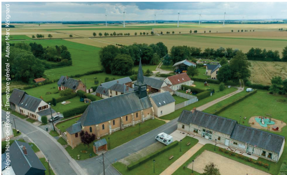
Le village de Viefvillers - Vue aérienne de la place de la mairie et de l'église depuis le nord-est.

L'équipe a ainsi rencontré les maires, les habitants et les propriétaires d'habitats traditionnels intéressants. Ce travail sur le terrain est complété par des recherches sur les documents écrits conservés aux archives départementales de l'Oise, situées à Beauvais, afin