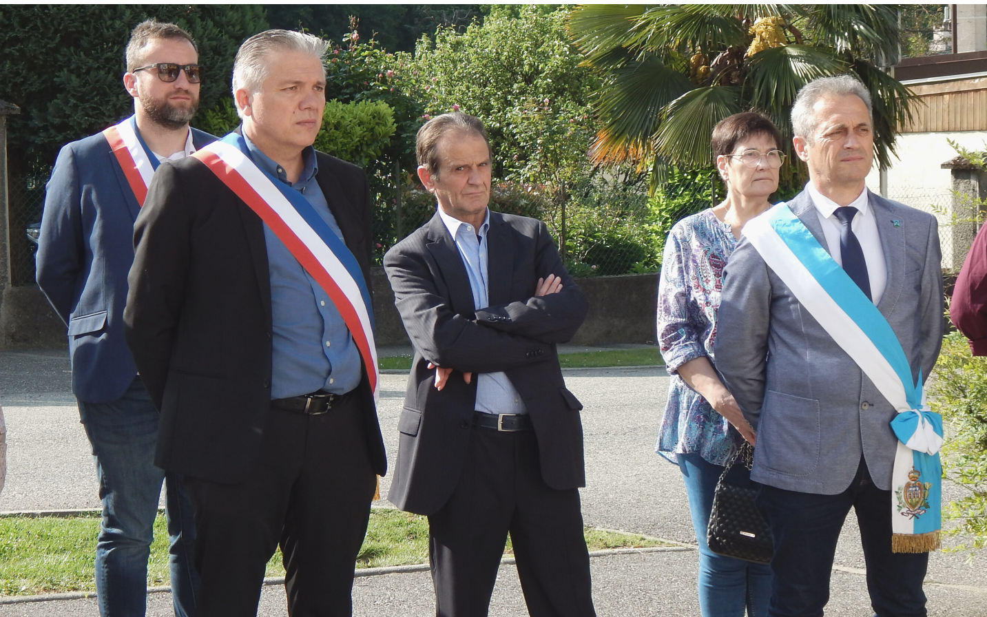
Froges et Acquaviva sont jumelées depuis 38 ans.