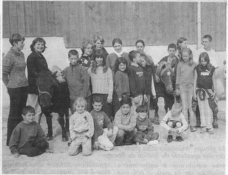
Les enfants prêts à partir en balade avec les poneys, en compagnie des animateurs