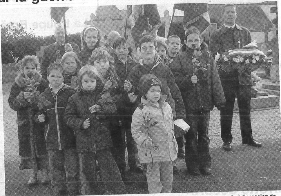
Après la visite de l'exposition, les enfants ont été déposer une rose au moment aux morts à l'occasion de la cérémonie du 11 novembre