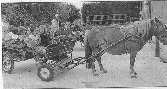
Le site de la Haute-Hairie propose de nombreuses activités pour découvrir la vie à la ferme.

Tout d'abord ferme pédagogique, elle accueille principalement des enfants de la maternelle jusqu'au CM2, pour une journée ou un séjour découverte. En fin de semaine dernière, la classe de petite section de l'école Louis-Étienne, d'Argentré-du-Plessis, est venue passer la journée dans cette ferme.