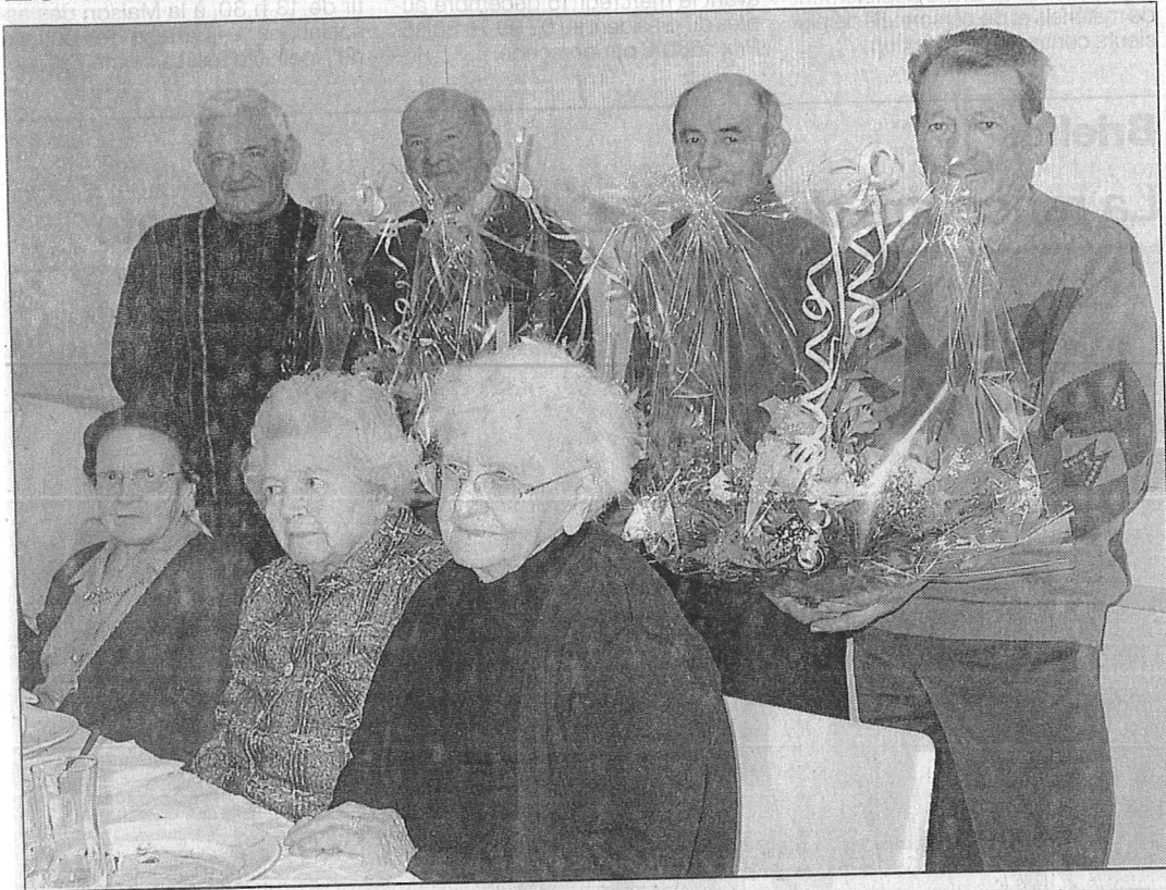
Aux côtés des trois doyennes, le club de l'Amitié a fêté ses 30 ans.