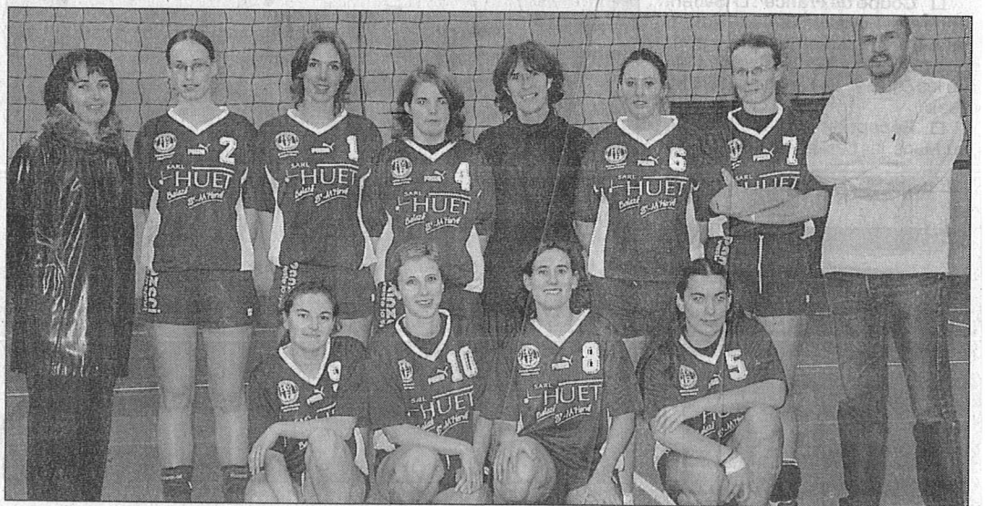
Les joueuses ont inauguré leurs nouveaux maillots offerts par la SARL Huet.

Date à retenir : Les benjamines de Haute Vilaine joueront à l'occasion des 16 es de finale de la Coupe de France. Le club recevra Saint Joseph Nantes et Clamart VB (région parisienne) le dimanche 12 décembre à 12 h à la salle des sports de Taillais.