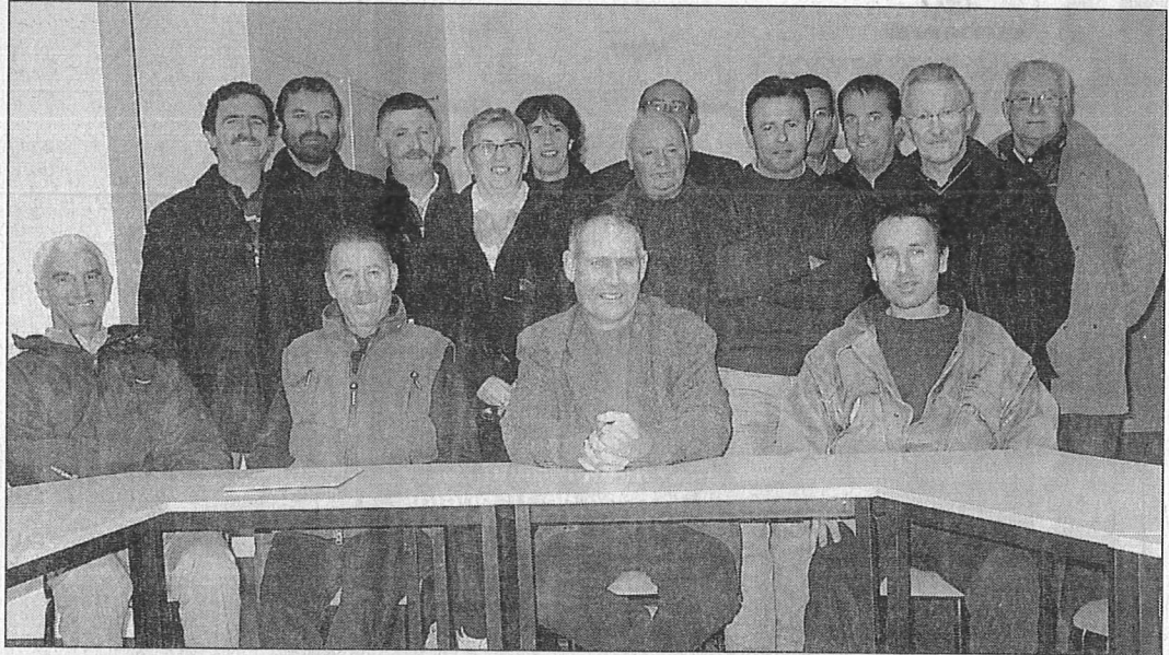
Les membres du comité des fêtes se sont rassemblés, jeudi, pour procéder à l'élection du nouveau président.

Cette célèbre manifestation fêtera d'ailleurs son 10 e anniversaire en 2005. Et comme chaque année, le comité participe activement aux fêtes du Bocage Vitréen, en partenariat avec Princé et Montautour. Il apporte également son aide pour l'organisation du championnat d'avi-