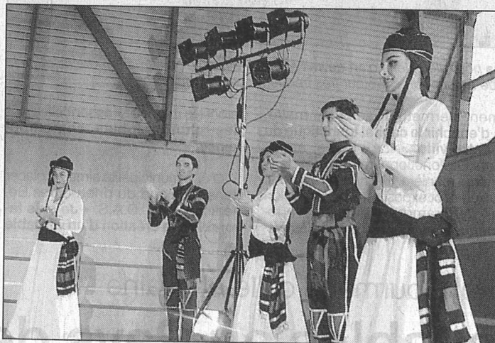
Le groupe Margality a séduit le public.

Changement de programmation, vendredi soir. Le groupe éthiopien Ezéra n'a pu se déplacer suite à un problème de visa. C'est donc le groupe Margality de Géorgie qui a eu rendez-vous avec le public. Ce dernier participe actuellement à la semaine du folklore du monde à Saint-Malo. L'ensemble est composé de neuf musiciens et d'une vingtaine de danseurs de dix à vingt ans, tous élèves de l'école de danse de Tbilissi. Trois cent cinquante personnes ont assisté à cette superbe soirée qui a soulevé de chaleureux applaudissements. Et personne ne s'est plaint du spectacle qui s'est déroulé finalement à la salle des sports. Météo oblige... A noter que cette soirée était proposée, conjointement, par les trois communes de Saint-M'Hervé, La Chapelle-Erbrée et Princé.