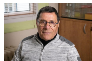
Maire de Courcelles de 2014 à aujourd'hui.