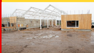
L'Accueil de Loisirs