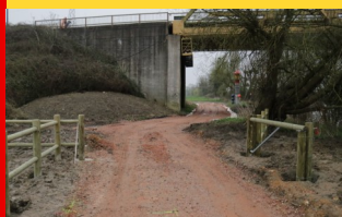
La Voie Verte