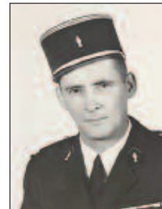
Roland Tempo de 1967 à 1988

1967-2022 : 4 chefs de Corps pour plus d'un demi-siècle :