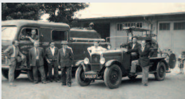
1956 : achat d'un fourgon tonne-pompe de la marque Simca