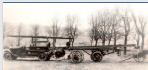
1932 : Evolution vers la mécanisation. Achat d'une autopompe de la marque Peugeot. Véhicule surmonté d'une échelle, remorque avec la grande échelle, dévidoir de tuyaux d'incendie et pompe à bras.

Tour sur laquelle en 1938 fut installé une sirène. Celle-ci mit définitivement fin au tocsin et à l'alarme donnée de quartiers en quartiers par les sapeurs-clairons ou tambours.