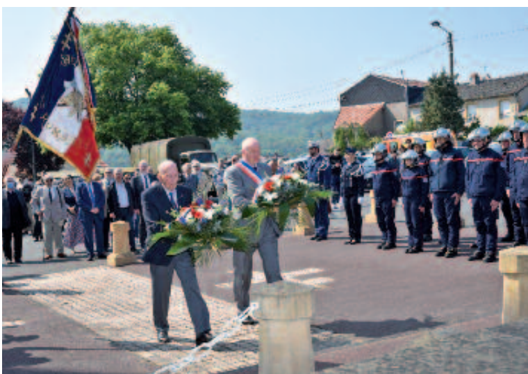
Dépôt de gerbes et allocutions au Monument aux Morts