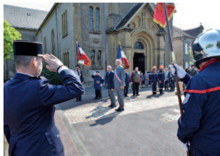
Hommage à celui qui a refusé la défaite et à toutes celles et ceux qui l'ont rejoint, au monument aux Morts et au square du Souvenir Français.