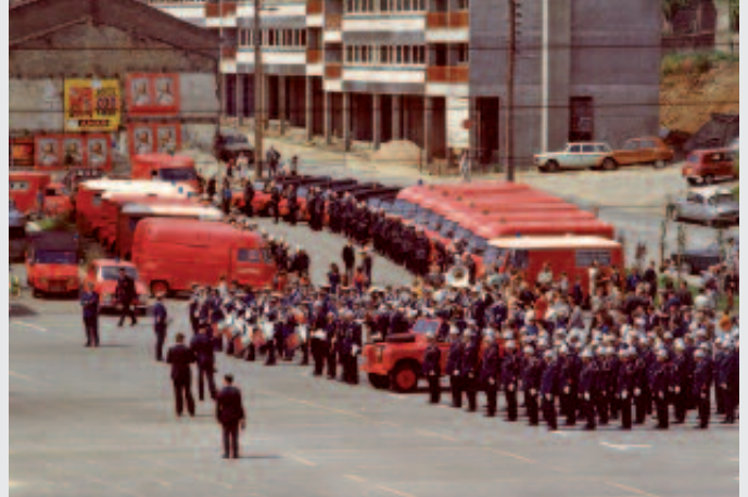
1972 : (nouvelle place du Dr Job) Congrès de l'Union Départementale des Sapeurs-Pompiers de la Moselle. Comme le symbole de la réussite-modernisation du Corps rombasien.

De nouveaux défis, que relevèrent les Sapeurs-Pompiers rombasiens et dont la modernisation accentuée du Corps en fut la partie visible : 1956, achat d'un fourgon tonne-pompe de la marque SIMCA (2500 litres) et de deux appareils respiratoires ; nouvelle caserne avec garages contiguë à